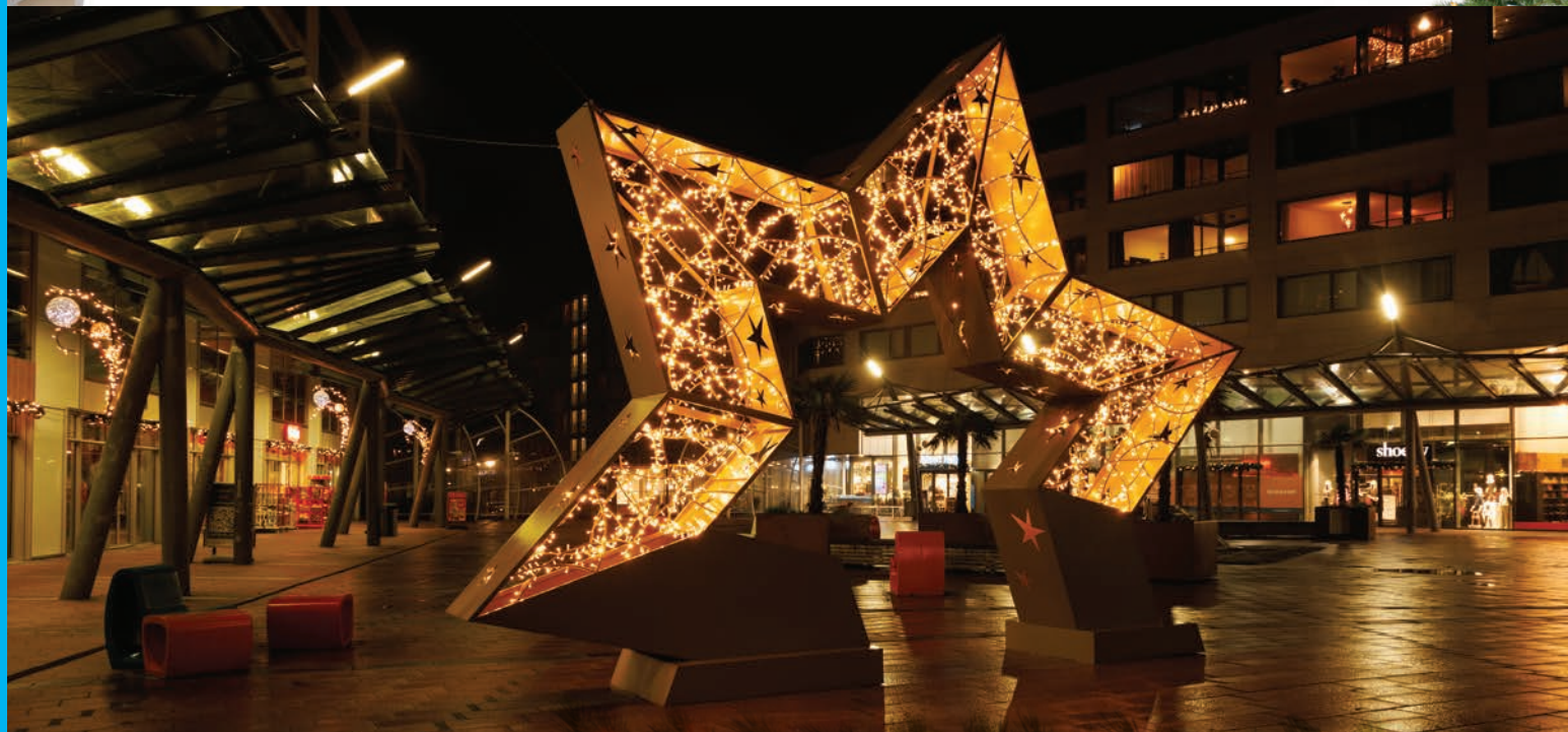
Kerst in Nesselande